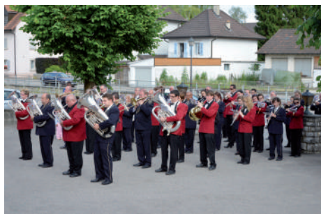
Un dernier morceau a été joué devant la mairie le dimanche 15 juin 2014.