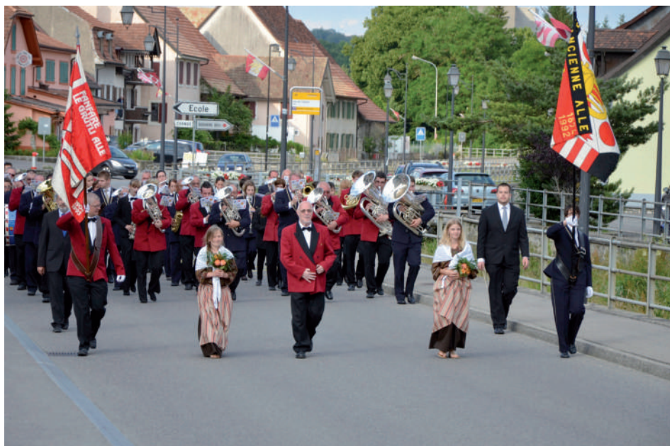
Les deux fanfares ont défilé ensemble à leur retour de la Fête Jurassienne de Musique.