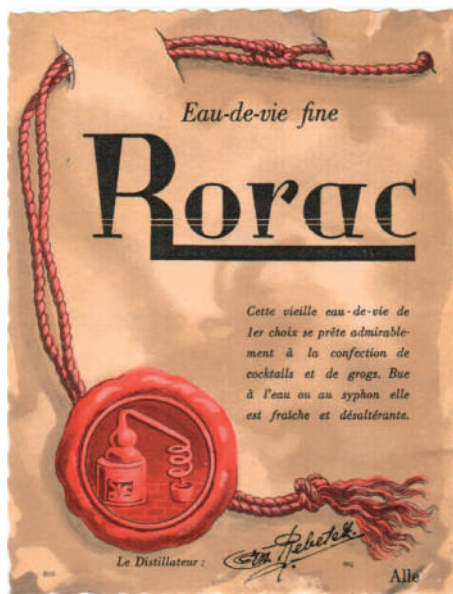
Document de François Caillet.