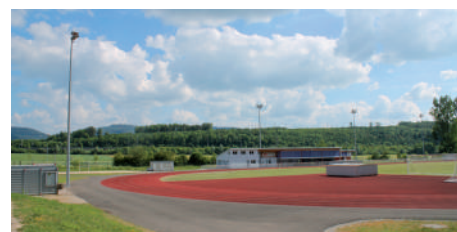
Centre sportif «Les Prés-Domont»

Le 19 juin 2004, les installations du nouveau centre sportif «Les Prés-Domont» étaient inaugurées. Le comité directeur en étroite collaboration avec la FSG Alle, le FC Alle et les autorités communales souhaite marquer ce 10e anniversaire.